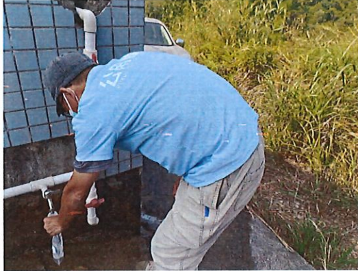
四堡水厂出厂水采样口