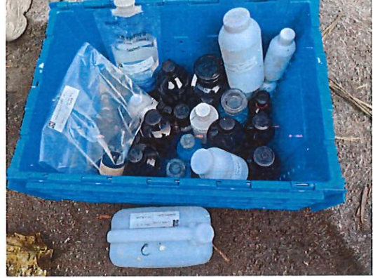
四堡水厂出厂水水样