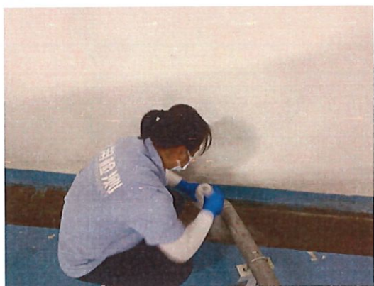
峻廷湾二期采样口